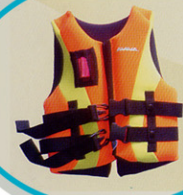
CHALECOS SALVAVIDAS DE NEOPRENO