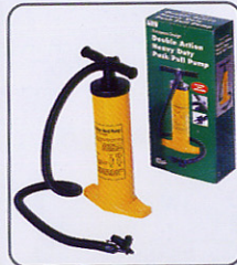
BOMBA MANUAL DE DOBLE ACCION